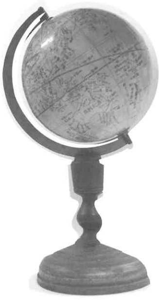
子規遺品 地球儀