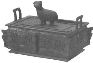
漱石遺品 銅四脚羊紐インク壺 県立神奈川近代文学館 所蔵