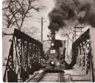
現在の道後温泉駅 昭和28年頃、横河原線石手川鉄橋を渡る坊っちゃん列車