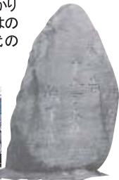
正岡子規句碑 (JR松山駅前)