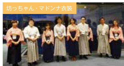
坊っちゃん衣装の袴には大きなスリットがあるため、黒いズボンの着用をおススメ。