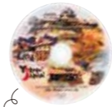
英語の字幕あり 約10分