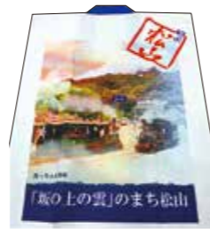
ハッピー裏(坊っちゃん列車ver.)