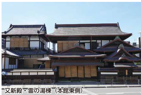
又新殿・霊の湯棟 (本館東側)