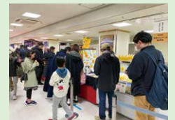
昨年開催時の様子