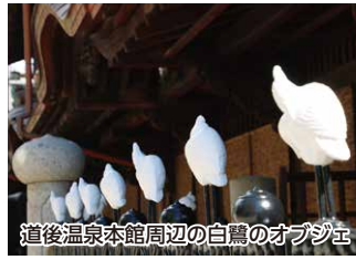
道後温泉本館周辺の白鷺のオブジェ