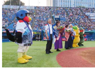
記念品贈呈セレモニー