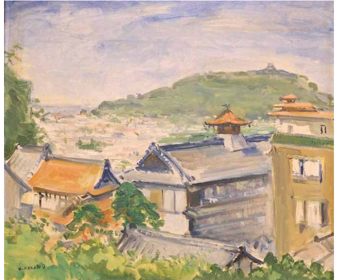
中野和高 本館風景