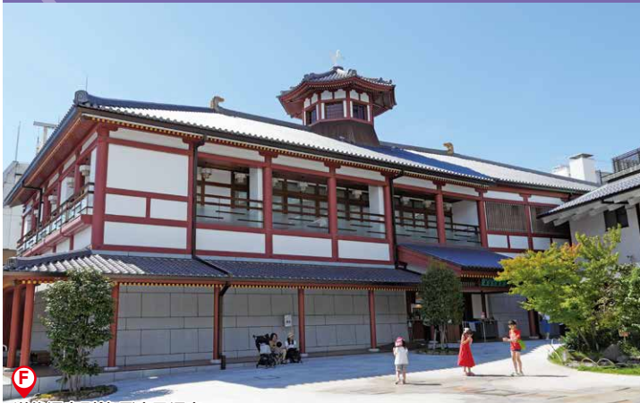
道後温泉別館 飛鳥乃湯泉