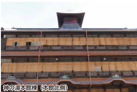
神の湯本館棟 (本館北側)