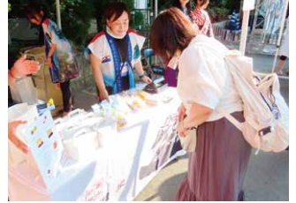
松山市の物産販売