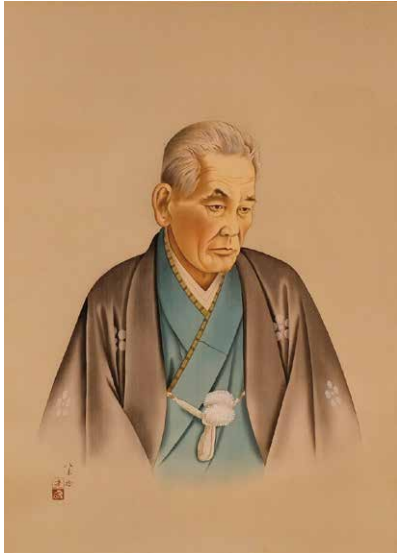
好永紫芳 伊佐庭如矢像

展示ではこれを記念し、伝承と史実が交錯しつつ形作られてきた道後温泉のイメージを多様な資料でたどるとともに、愛媛における文化の一大集積地ともいえる「道後」という地域で展開した独自の文化芸術の諸相に目を向けます。道後にまつわる伝承や歴史的経緯を示す資料、保存修理工事に愛媛県美術館が協力した美術品調査によって見出された、道後温泉本館伝来の品々などを紹介します。