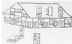
江戸時代の道後温泉の様子 出典「道後温泉本館の歴史」 平成6年3月 松山市

玉の石は、道後温泉本館の北側にあり、少彦名命の足跡が残っているといわれており、ひしゃくでお湯をかけてお祈りすると、願いが叶うといわれています。玉の石がいつから道後温泉本館の北にあったのかは、はっきりしていません。ただ、江戸時代・寛永15年(1638年)に描かれた「寛永15年温泉絵図」にはすでに、本館のそばに「玉ノ石」と書かれていることがわかり、少なくとも約400年前にはこの場所に玉の石があったことが分かります。