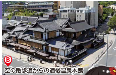
B 空の散歩道からの道後温泉本館

今回の工事では、道後温泉本館の歴史的価値や文化的価値を残していくために、見た目や雰囲気を変えないよう、様々な工夫を行いながら耐震補強や配管などの設備の更新を行いました。そのため、外観は改築130周年を迎えた本館の変わらぬ風情が楽しめます。内観では、見た目は大きく変わっていませんが、よく見ると建物の強度を高めるために浴室など壁の厚みが増している個所があります。再開にあわせて、1階に売店コーナーが新設され、新しいデザインのうちわなどが購入できます。