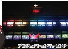
プロジェクトンマッピング

道後温泉本館は、平成31年1月15日から保存修理工事を行っています。今回の工事は、国の重要文化財に指定されている本館を大切に受け継ぎ、末永く地域のシンボルとして輝き続けることができるように、湿気などにより傷んでいた建物の強度を高めるための補強や変わらず営業を続けていくための設備更新などを行いました。工事中は部分営業を続け、プロジェクトンマッピングや見学会などにより、工事中ならではの取組みを行い、本館の魅力を発信し、多くの方々に魅了しました。